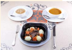
Ejemplo de una comida para persona alérgica