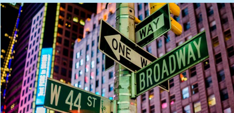
MUSEOS Y ESPECTÁCULOS

Una vibrante e intensa oferta cultural que te da la oportunidad de visitar museos tan reconocidos como el MoMA, asistir a un evento deportivo o a uno de los famosos espectáculos de Broadway. La ciudad que nunca duerme te espera.