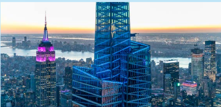
MIRADORES DE LA CIUDAD

La ciudad que nunca duerme es el destino ideal para los aventureros, para los amantes de los museos, los aficionados a los musicales, los comedistas y, por supuesto, para los adictos a las compras. La historia, la gastronomía, la moda, el arte y la música de Nueva York se han ido moldeando a lo largo de décadas de inmigración. Con tantas opciones, puede resultar abrumador elegir qué hacer, por eso hemos seleccionado para ti nuestras actividades favoritas. Desde los rascacielos más emblemáticos hasta los reconocidos museos de arte, pasando por las brillantes luces de Broadway, he aquí las actividades y experiencias imprescindibles en la Gran Manzana.