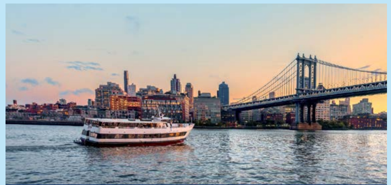
CRUCEROS DE NUEVA YORK

Otra manera especial de conocer la ciudad es navegar por los ríos que rodean Manhattan. Sube a bordo y disfruta de las vistas de la ciudad.